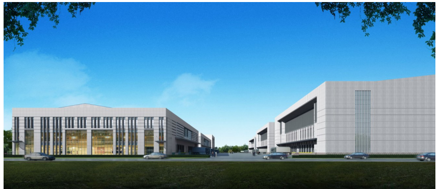
冷链物流区效果图

当前,国内大部分冷链企业服务观念比较传统落后,同质化竞争严重,大大影响行业效率。随着移动互联网时代的崛起和科学技术的飞跃发展,冷链物流产业蕴含无限机遇,企业的组织分工和业务模式存在很多变化空间,要实现多元化发展冷链市场,就要求企业向供应链、宅配、零担、平台化等多个方向转型升级。(下转第2版)