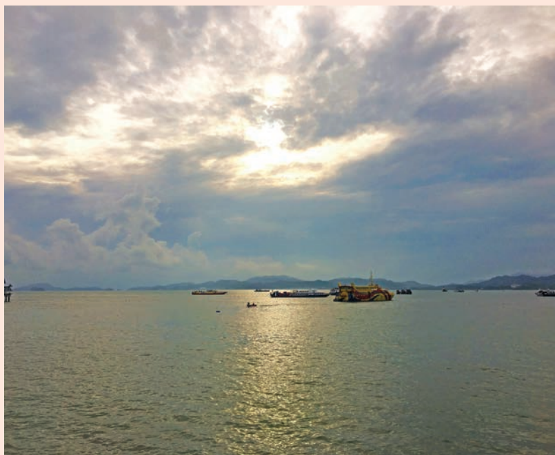
海岸风情