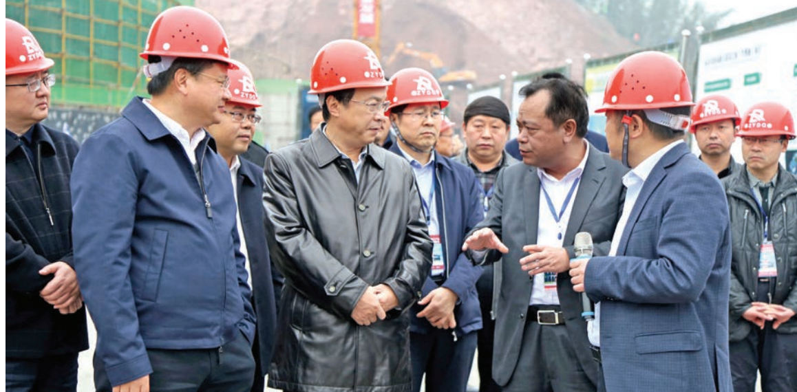
省委常委、市委书记龙长春听取遵义交通旅游投资(集团)有限公司党委书记、董事长唐小宇关于农商旅互联综合体项目建设情况汇报

据了解,赤水市农商旅互联综合体(竹博城)项目总投资2亿元,于今年7月1日开工建设,预计将在2018年4月底前建成投用,年收入可达4亿元,实现年税收3000万元,新增200个就业岗位,且所有岗位将优先解决精准扶贫对象就业。在赤水市现代服务业兴起、经济保持着高速发展的当下,该项目的建设为当地全面构筑了一个优势互补、资源共享的区域经济体系。(龚世丹)